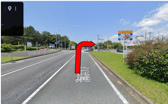
京葉道路 幕張インター方面

約2km直進 5つ目の交差点（ヨットハーバー交差点）を右折 右折専用レーンあります。